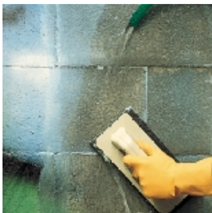
Limpeza com feltro abrasivo

Deixar actuar por 5-10 minutos e em seguida retirar o gel com uma hidrolimpadora. Em ambientes onde não seja possível operar com água em pressão, WallGard GRAFFITI REMOVER GEL pode ser retirado facilmente com água