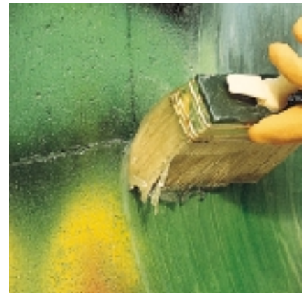
Aplicação de WallGard GRAFFITI REMOVER GEL com pincel