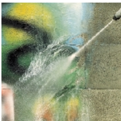
Lavagem com água sob pressão