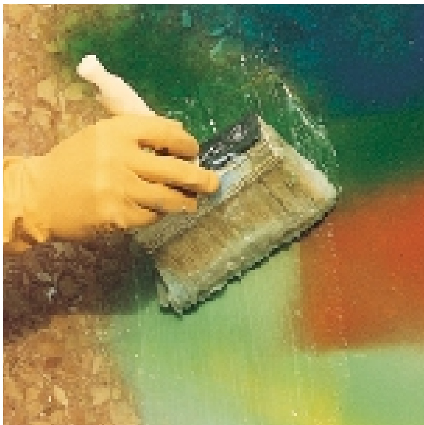
Aplicação de WallGard GRAFFITI REMOVER GEL sobre pedra natural