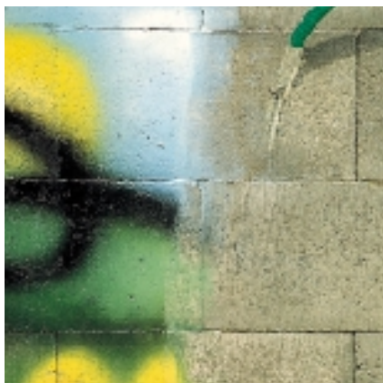
Lavagem com água corrente