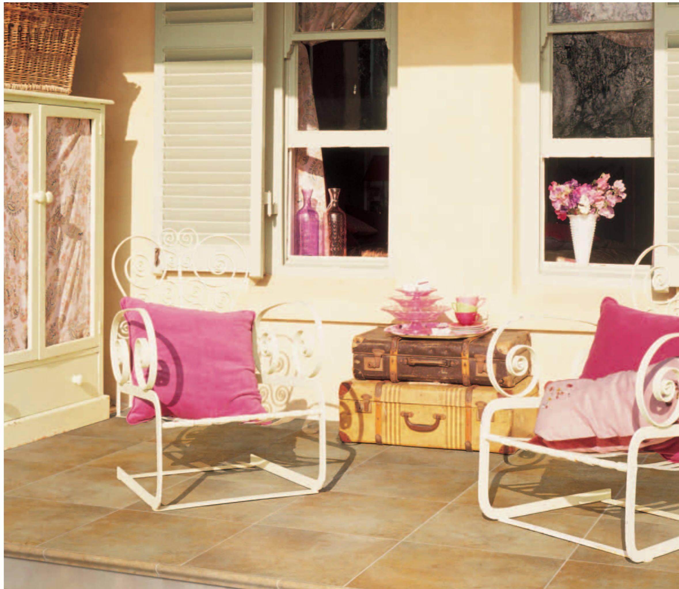
CHANVRE 45x45 GRADINO CHANVRE 5x33