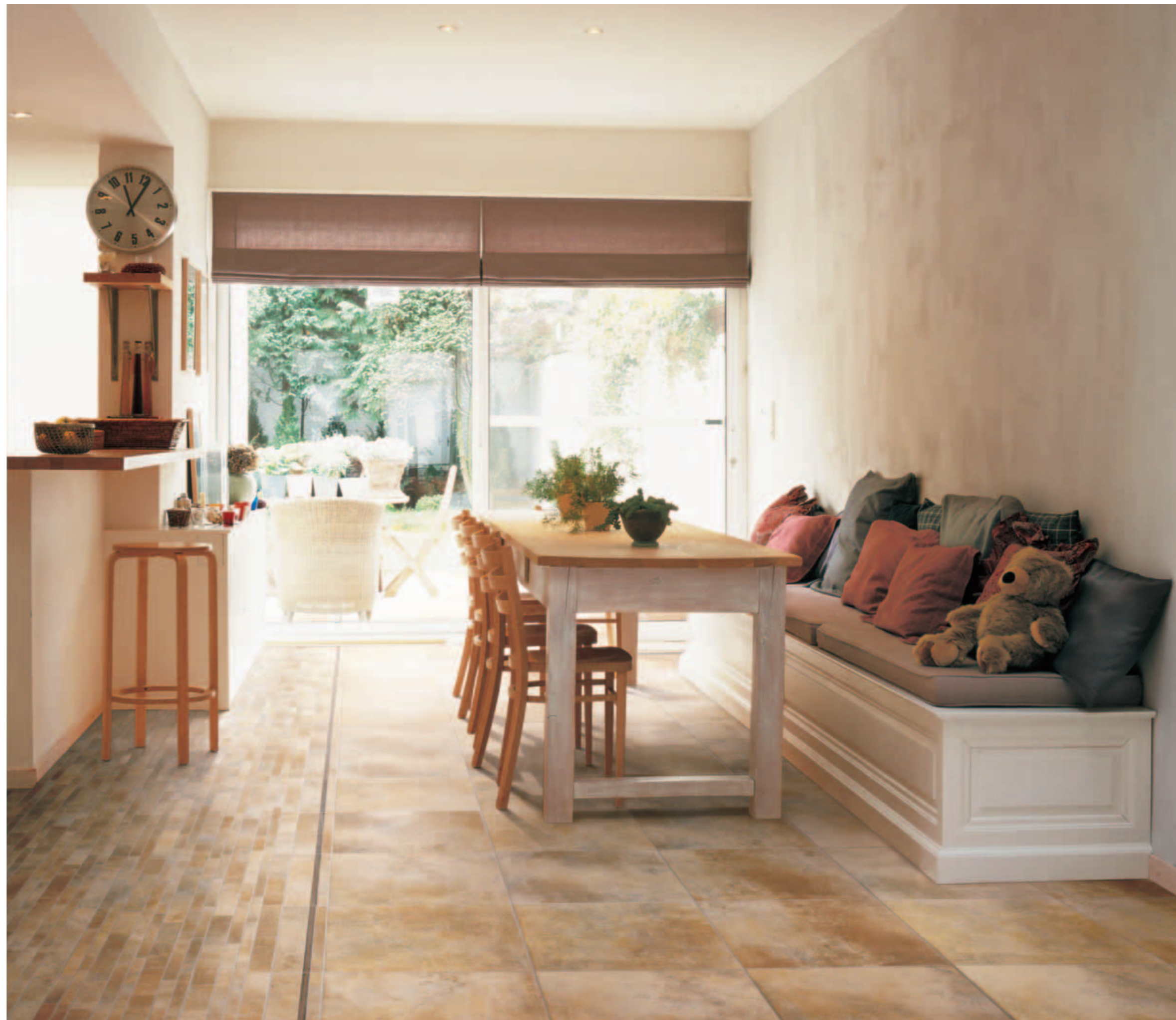
SABLE 45x45 FASCIA SU RETE METALLO SABLE 11x45 MOSAICO MURETTO SABLE