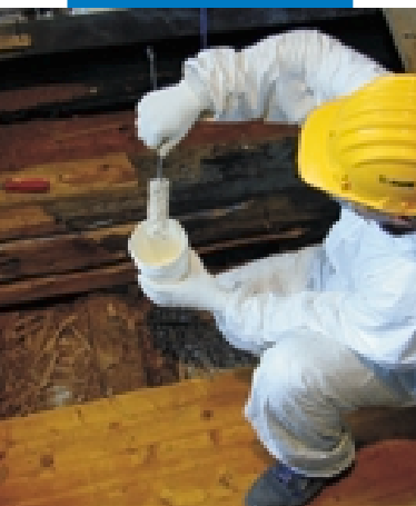
Fase applicativa di Mapewood Primer 100