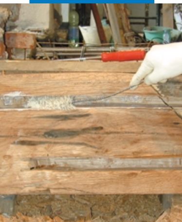
Applicazione di Mapewood Primer 100 mediante scovolino

praticando un taglio di opportune dimensioni sul lato più facilmente accessibile (solo quando si impiega per l'ancoraggio della nuova protesi Mapewood Paste 140 ). Cercare di evitare, durante le operazioni di taglio e di foratura la formazione di scheggiature e di bruciature superficiali ed, inoltre, la creazione di zone con fibratura strappata o schiacciata.