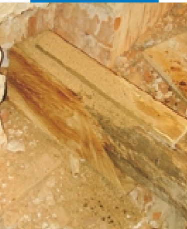
Elemento strutturale prima dell'applicazione di Mapewood Primer 100